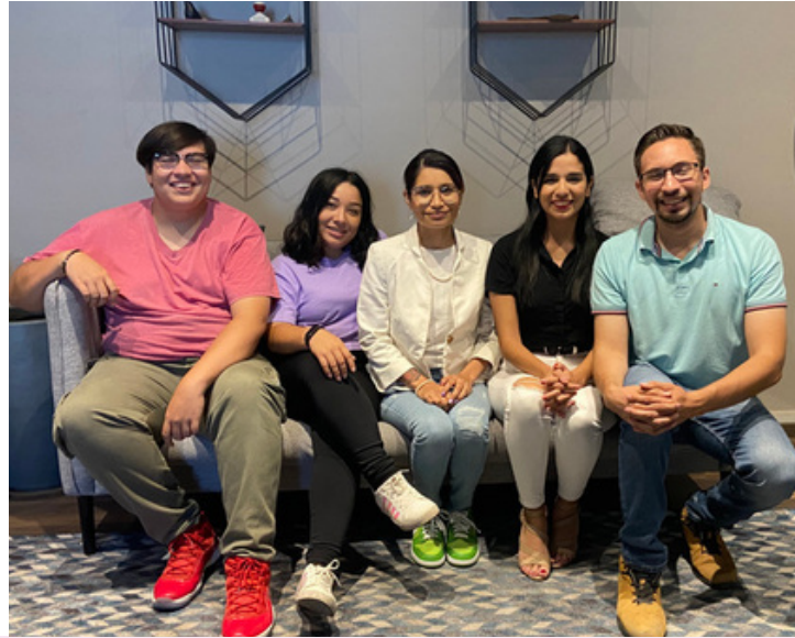
Equipo San Nicolás