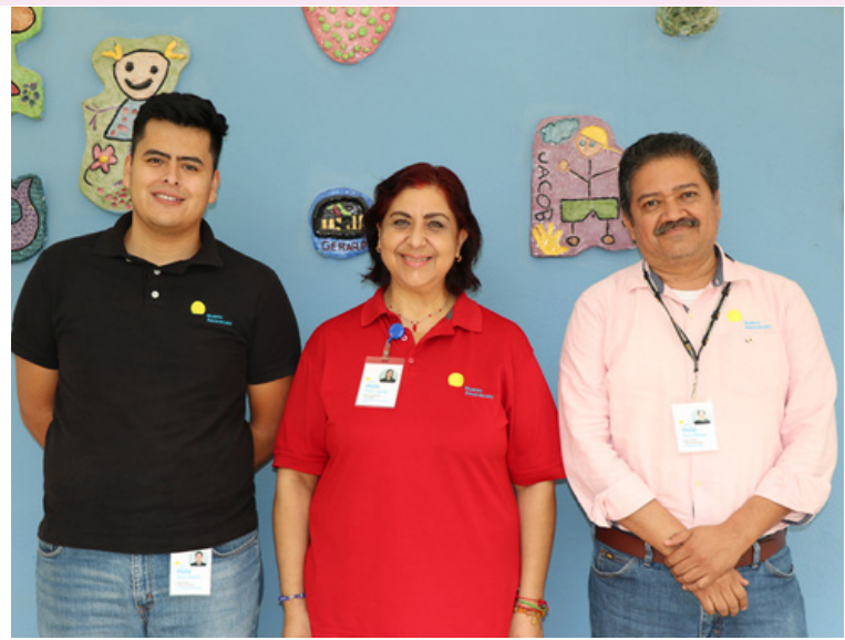
Equipo Instituto Nuevo Amanecer