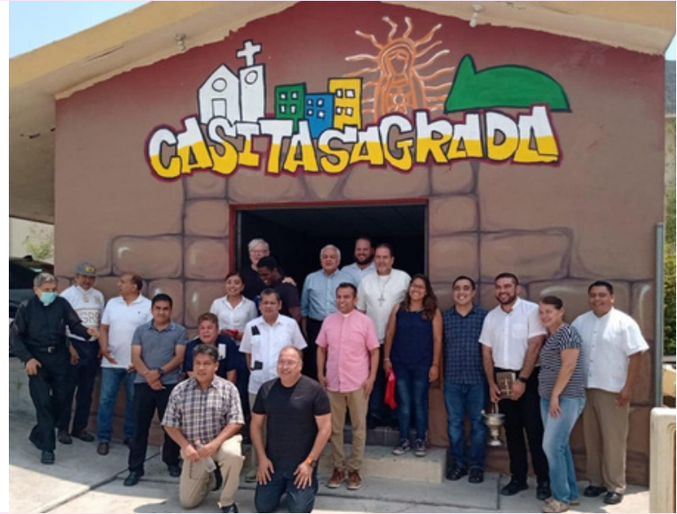
Equipo "La Casita Sagrada" Proyecto Topo Chico