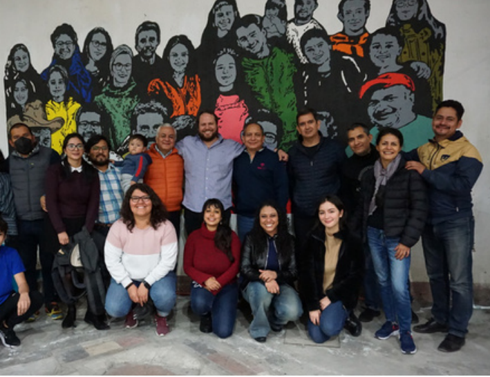
Equipo Telar - CIAS