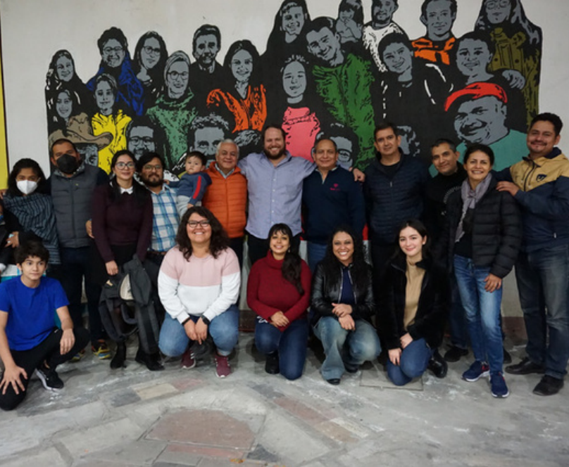
Equipo Telar - CIAS