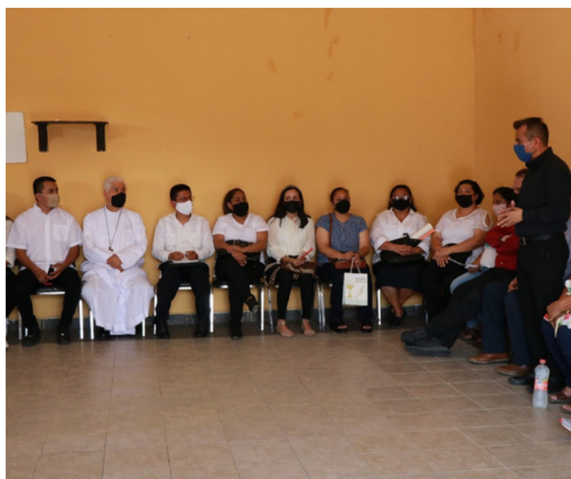
Parroquia San Rafael Arcángel de Monterrey