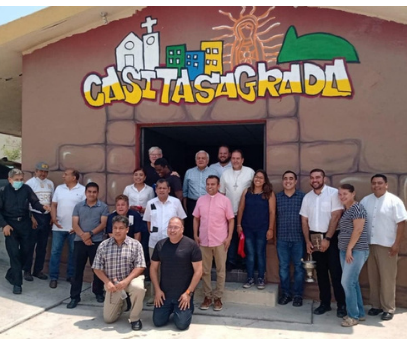
Equipo "La Casita Sagrada" Proyecto Topo Chico